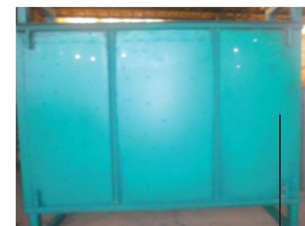
Photo fond extérieur de la benne