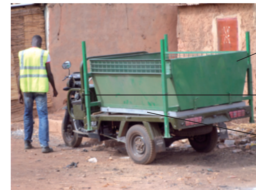
Porte arrière de la benne

Ce sont les mêmes types de motocyclette qui se trouve sur le marché : le Tricycle motorisé de 125 cm 3 a été équipée d'un cadre à came