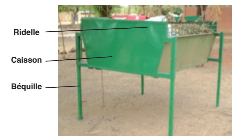
Benne déposée sur les béquilles