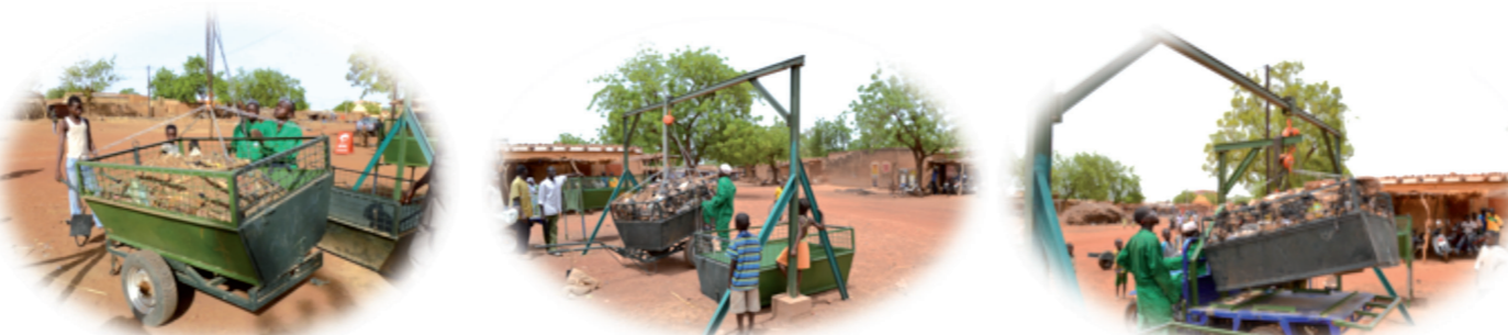
Photo 2,3,4 : éléments système charrettes benne triporteur version Palan

Les différents tests effectués par les utilisateurs sur le terrain ont permis d'affiner progressivement les matériaux pour arriver au modèle actuel qui est en cours de reproduction. Cela a nécessité beaucoup de travail, de concertation entre l'équipe du projet, ses partenaires techniques et les utilisateurs.