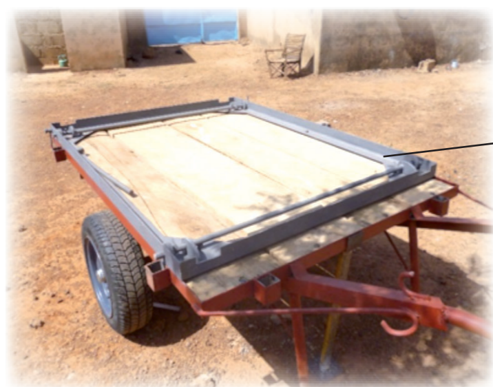
Cadre de came installé sur la charrette